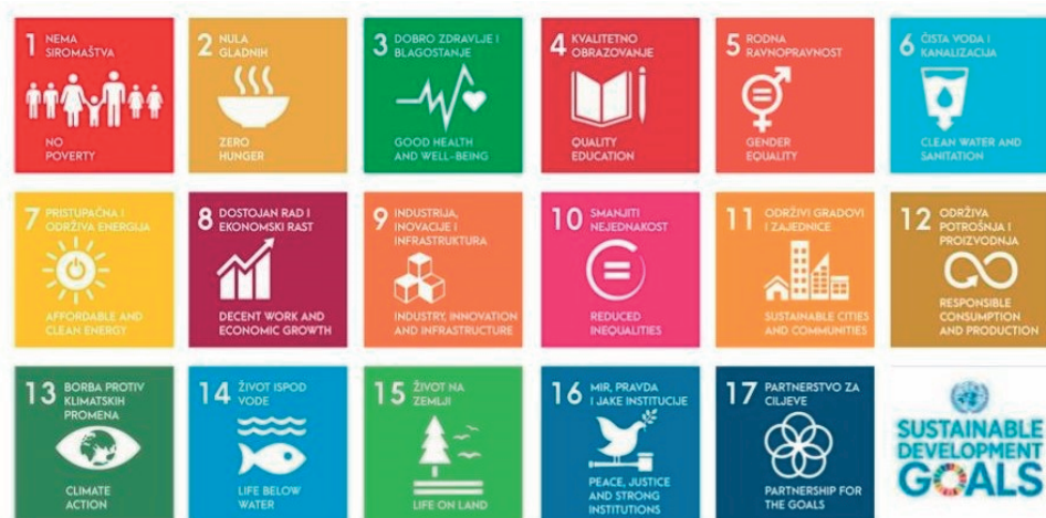
Slika 1. Ciljevi održivog razvoja [3]