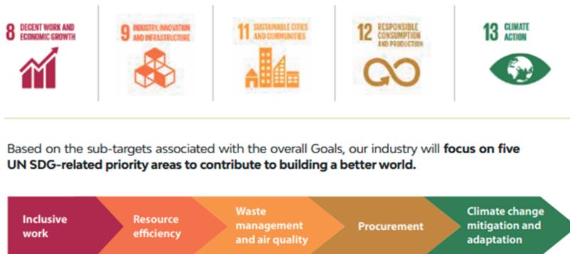
Slika 2. Fokus na pet Ciljeva održivog razvoja [8]

Usvajanjem Agende održivog razvoja 2030 i Ciljeva održivog razvoja Ujedinjenih nacija 2015. godine, Međunarodna poštanska korporacija podržala je članove PostEvrope i poštanske operatore iz drugih regija u sprovođenju istraživanja kako bi se utvrdilo koji su od Ciljeva održivog razvoja najrelevantniji za globalnu poštansku industriju, i u fokusu poštanskog sektora je 5 ciljeva (Slika 2), i to: Cilj 8 : Dostojanstven rad i ekonomski rast, Cilj 9 : Industrija, inovacije i infrastruktura, Cilj 11 : Održivi gradovi i zajednice, Cilj 12 : Odgovorna potrošnja i proizvodnja, i Cilj 13 : Borba protiv klimatskih promena.