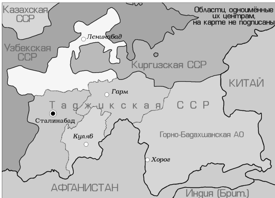
Карта бр. 1: Гармска област и унутрашња организација Таџикистанске ССР 1940. године 2

Специфичност позиције Таџикистана одређује и комплексно историјско наслеђе, које се нити може нити сме искључиво везивати за „изненадно“ стицање независности узроковано распадом Совјетског Савеза и релативном неспремношћу да се започне „нови циклус“ у државотворном процесу. Таџици су део шире иранске етничке заједнице, говоре језиком који је дијалект персијског, али су поред тога већином сунити (за разлику од иранских шиита), што их у погледу религијског, више