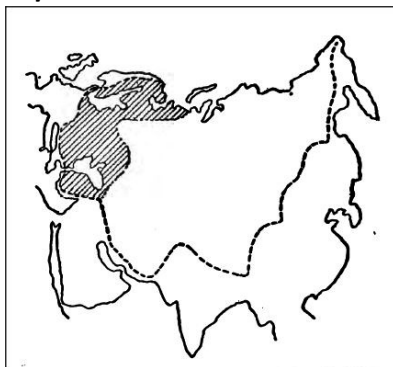
Mapa 2: Mekinderov prikaz središnje zemlje ( heartland ) – proširene stožerne oblasti V 8

U studiji od 1919. godine, Mekinder koncept stožerne oblasti zamenjuje pojmom središnje zemlje ili hartlanda ( heartland ), koji pored stožerne zemlje obuhvata, kako kaže, zarad svrhe strategijskog mišljenja, „Baltičko more, plovni srednji i donji Dunav, Crno more, Malu Aziju, Jermeniju, Persiju, Tibet i Mongoliju”. 5 Prema mišljenju Hansa Vejgerta (Hans W. Weigert), poznatog političkog geografa i delom Mekinderovog savremenika, središnja zemlja Evrope i Azije od 1918. godine ima suštinski iste granice kao i Mekinderova stožerna oblast od 1904. godine. 6 Na Mapi 2, Mekinder je šrafirao regione koje su „priključeni” stožernoj oblasti od 1904. godine (suštinski posmatrano, reč je o istočnoj i centralnoj Evropi, kao i Maloj Aziji). I središnja zemlja odlikuje se onom ključnom predispozicijom koja je pripisana stožernoj oblasti, što dobro sumira profesor Vejgert, koji kaže da hartlend kao strategijski koncept uključuje sve regione koji mogu biti uskraćeni pomorskoj sili ( all regions which can be denied sea power ). 7 Iz pretpostavljenog značaja središnje zemlje, Mekinder je izveo znamenit deduktivan zaključak da onaj ko vlada Istočnom Evropom (praktično „kapijom” hartlanda) vlada i samim hartlendom; da vladavina hartlendom omogućava dominaciju nad svetskim ostrvom (evro-azijsko-afričkim kopnom); i konačno, da vladanje svetskim ostrvom omogućava dominaciju nad svetom.