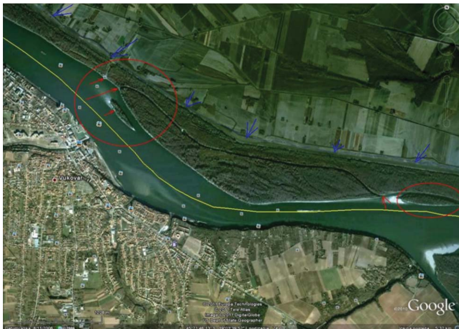
Karta 2. Satelitski snimak Vukovarske i Šarengradske ade