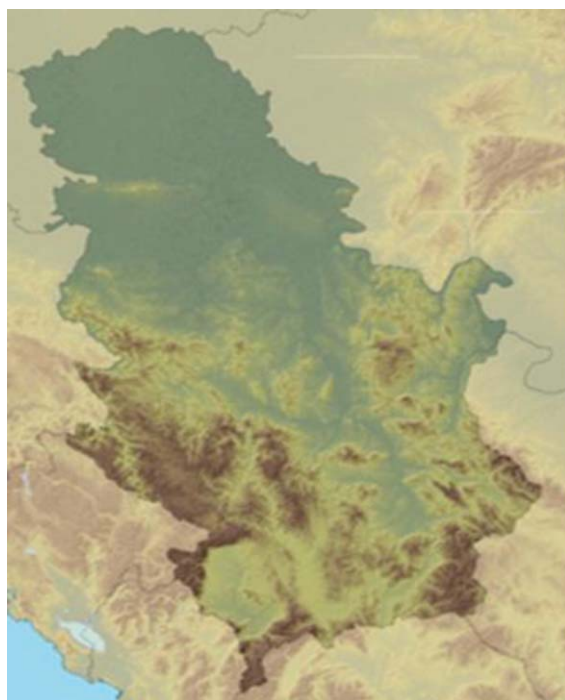
Karta 1. Reljef državne teritorije Republike Srbije

Svakako i neosporno u prvu vrstu podele otorenih pitanja u Dunavskom region nalazi se višedecenijski međudržavni spor predstavnika vlasti u Republici Srbiji i Republici Hrvatskoj u vezi dve Ade – Šarengradske i Vukovarske.