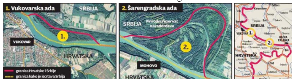
Slika 3. Vukovarska i Šarengradaska ada

za čekanje. Ilok sa opštinom Bačka Palanka učestvuje u zajedničkim programima prekogranične saradnje koje finansira EU. U stalnoj smo vezi i tražimo zajedničke projekte. Saradujemo i sa drugim opštinama iz Srbije. Bilo bi glupo da se mrštimo sa obala jedni na druge. Bolje je da radimo zajedno. Lepši je osećaj, a Evropa to ionako finansira...” 16