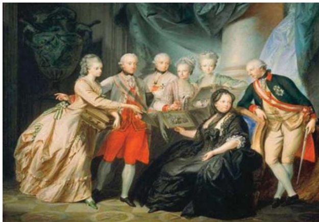
Slika 1. Heinrich Friedrich Füger: Marija Terezija sa porodicom 1776. godine

U XIX veku, reka Dunav je počela da pravi sopstveni meandar. Taj prokopani vodeni kanal (Mohovo-Šarengradski kanal od 1909. godine), što je aktuelni srpsko-hrvatski bilateralni spor ali i međunarodna multilateralna specifičnost u pregovorima državnih zvaničnika. Razlog tome je, sadašnji, glavni tok reke Dunava.