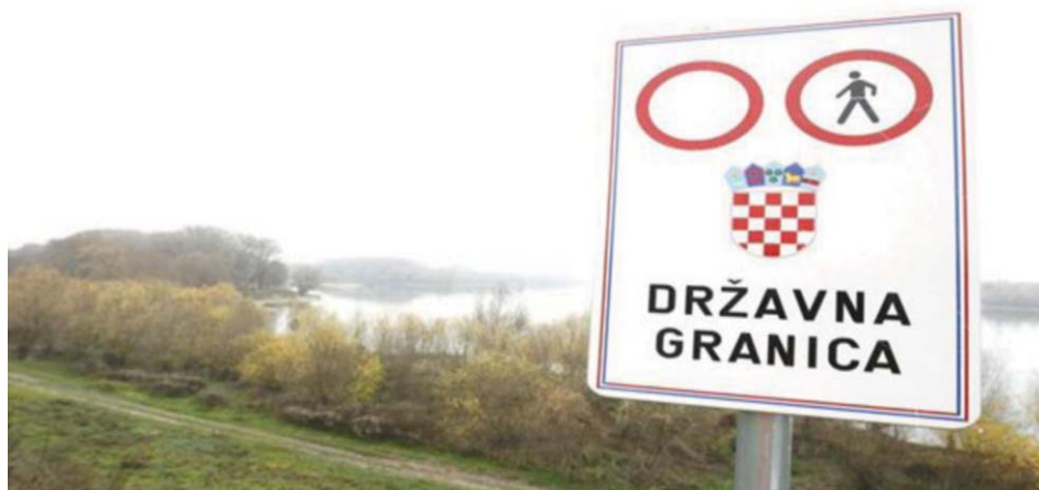
Slika 2. Sadašnji znak za državnu granicu Republike Hrvatske