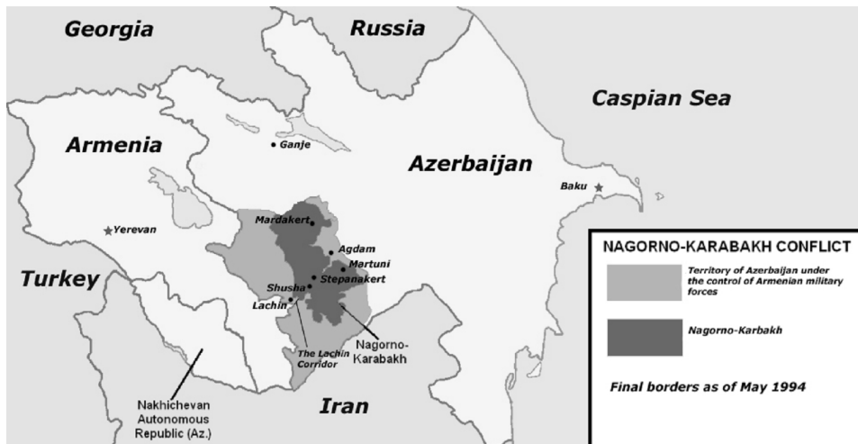
Slika 1: Region Nagorno Karabakh i teritorija Azerbejdžana pod okupacijom