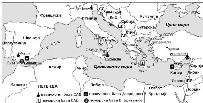
Карта 3: Америчке и британске ваздухопловне и поморске базе у Средоземљу