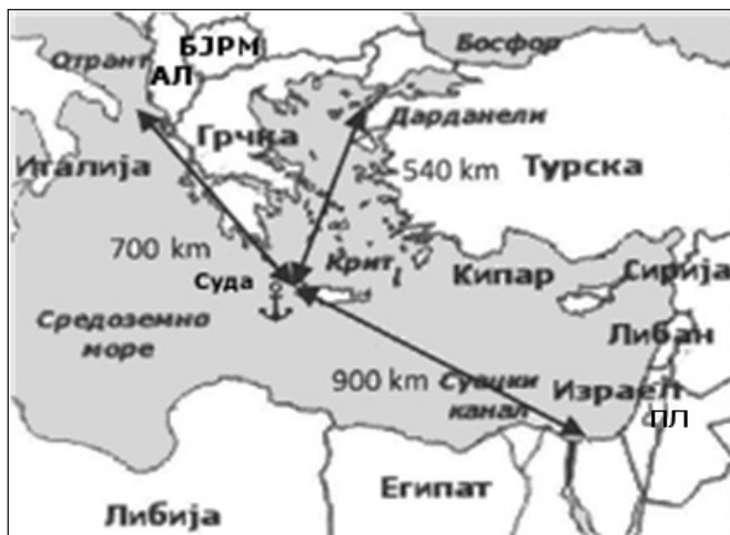
Карта 4: Геостратегијски положај острва Крит (растојања су рачуната од поморске базе Суда)