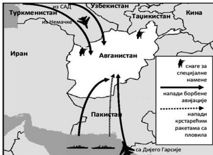
Мапа бр. 3. Напад на Авганистан 2001. године