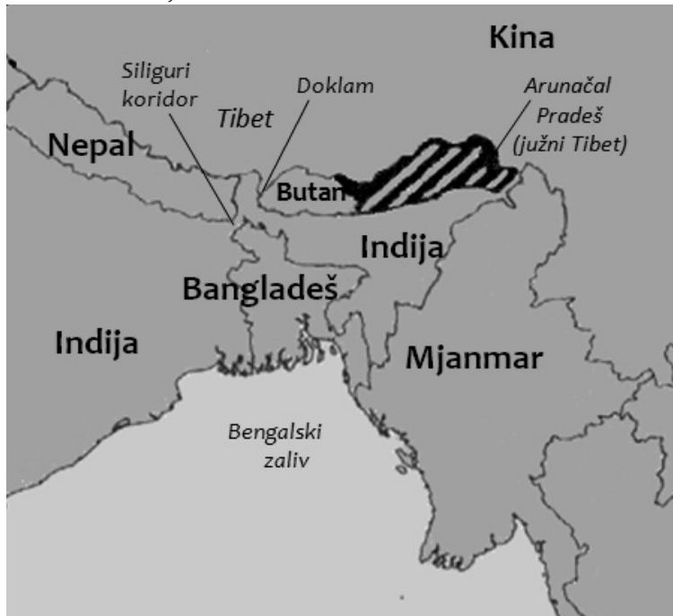
Mapa br. 1. Pozicija Doklama, Siliguri koridora i indijske savezne države Arunačal Pradeš

stav Indije (u kojoj boravi Dalaj Lama sa svojim sledbenicima) pobuđuje zabrinutost. Osim neposrednog sučeljavanja na granici, politički i strateški interesi Indije i Kine se sudaraju kako na kopnu (u južnoj Aziji), tako i na moru (na Indijskom okeanu).