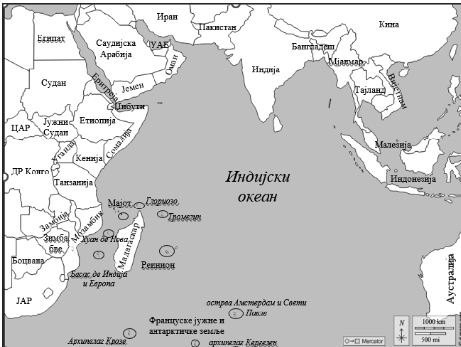
Мапа бр. 1: Француски поседи у Индијском океану

од Мексика. Поред ових француских поседа у различитом правном и административном статусу, Париз поседује и две базе на рубовима Индо-Пацифика – једну у Џибутију и другу у Уједињеним Арапским Емиратима (УАЕ). На француским поседима у Индо-Пацифику живи око 1,6 милиона француских грађана, и још барем 200 хиљада у другим државама овог региона. Ови поседи обезбеђују Француској и око 9 милиона км 2 ексклузивне економске зоне (Ministère des Armées 2019b, 2).